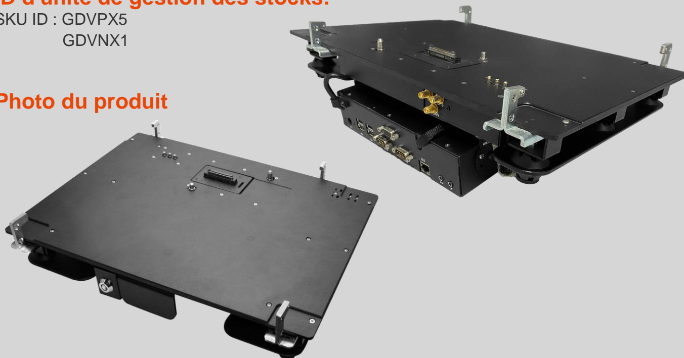
Photo du produit